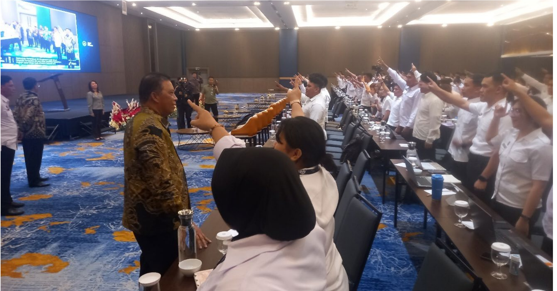
RAPAT Konsolidasi Pelaksanaan Program Makan Bergizi Gratis bersama kepala SPPG, yayasan, dan mitra MBG di Minahasa Utara, Jumat (8/5/2026).

MAKAN Bergizi Gratis (MBG) memberi manfaat bagi balita, ibu hamil, ibu menyusui dan peserta didik. Selain itu juga menjadi penggerak ekonomi masyarakat bawah di Sulawesi Utara.