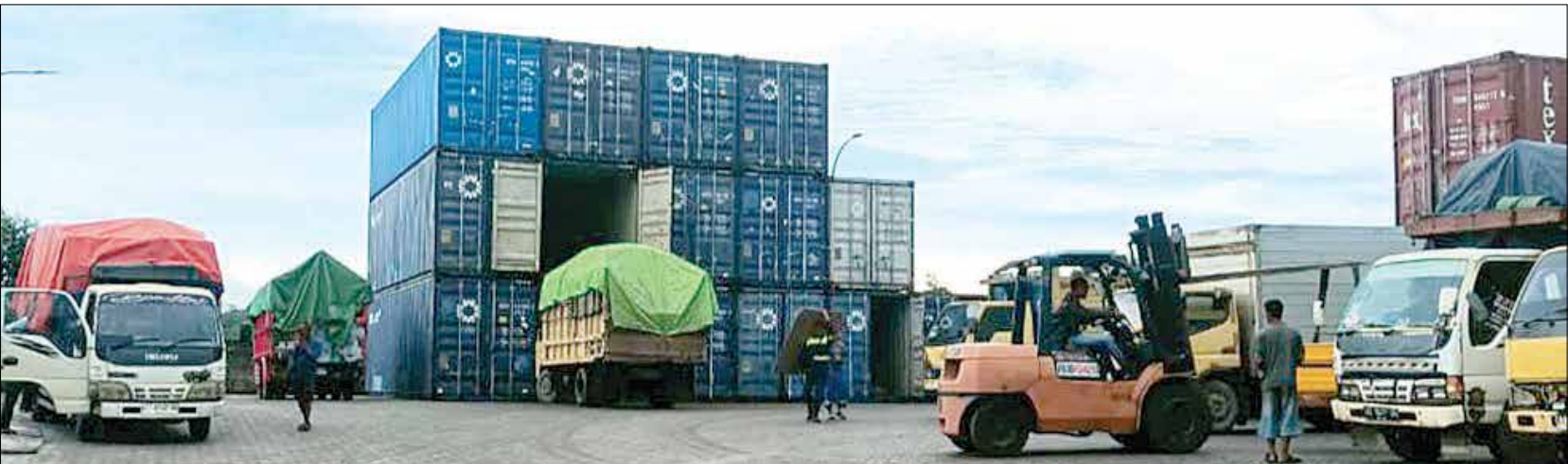
PINTU UTAMA: Aktivitas perdagangan luar negeri di Kaltim masih bertumpu pada sejumlah pelabuhan utama. Balikpapan jadi pintu keluar-masuk barang, baik untuk ekspor maupun impor.