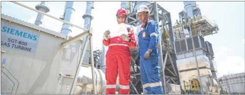
OBVITNAS: Disnaker Balikpapan mendorong adanya komitmen prioritas bagi tenaga kerja lokal yang telah memiliki pengalaman di proyek RDMP agar dapat terserap pada fase operasional.

lebih ramping dibanding fase konstruksi, namun menuntut kompetensi yang lebih spesifik dan berbasis teknologi operasi kilang modern. Kebutuhan tenaga kerja operasional ke depan diperkirakan lebih banyak difokuskan pada sektor operasi kilang, maintenance, instrumentasi, serta jasa penunjang industri lainnya. Karena itu, Disnaker Balikpapan mendorong adanya komitmen prioritas bagi tenaga kerja lokal yang telah memiliki pengalaman di proyek RDMP agar dapat terserap pada fase operasional. Selain itu, pemerintah juga menekankan pentingnya program reskilling dan upskilling guna menyiapkan tenaga kerja menghadapi kebutuhan industri yang semakin kompetitif. Program peningkatan kompetensi tersebut direncanakan dilakukan melalui pelatihan Disnaker, kerja sama dengan Balai Pelatihan, hingga program pemagangan bersama perusahaan-peru-