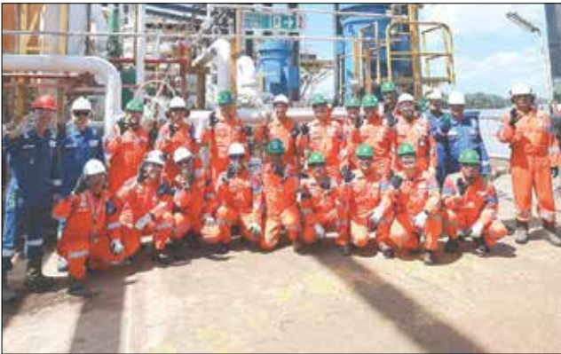
GENJOT PRODUKSI: Melalui berbagai kegiatan peningkatan keandalan fasilitas produksi, PHM menunjukkan komitmen menjaga integritas aset, serta mendukung keberlanjutan produksi migas dan ketahanan energi nasional.

KUTAI KARTANEGARA — PT Pertamina Hulu Mahakam (PHM) mencatat peningkatan produksi minyak di Lapangan Handil, Kalimantan Timur, setelah menyelesaikan Program Handil Rejuvenation sebagai bagian dari upaya menjaga keberlanjutan operasi lapangan migas mature yang telah beroperasi lebih dari lima dekade. Pasca pelaksanaan planned shutdown dan perawatan fasilitas produksi di Central Processing Area (CPA), produksi Lapangan Handil kembali beroperasi dengan kapasitas 15.020 barel minyak per hari (bopd). Angka tersebut meningkat sekitar lima persen dibandingkan sebelum penghentian operasi sementara dilakukan. Direktur Utama PT Pertamina Hulu Indonesia, Sunaryanto, mengatakan peningkatan produksi tersebut didorong optimalisasi sistem proses dan compressor setelah program perawatan serta peningkatan keandalan fasilitas produksi selesai dijalankan. “Peningkatan produksi itu didukung oleh kinerja sistem proses dan compressor yang lebih optimal setelah pelaksanaan perawatan fasilitas,” ujarnya. Program Handil Rejuvenation menjadi salah satu langkah strategis perusahaan dalam memperpanjang usia operasi lapangan mature, meningkatkan keandalan aliran fluida, sekaligus menjaga produktivitas aset migas nasional secara berkelanjutan. Program ini juga dinilai sejalan dengan upaya mendukung ketahanan energi nasional dan target swasembada