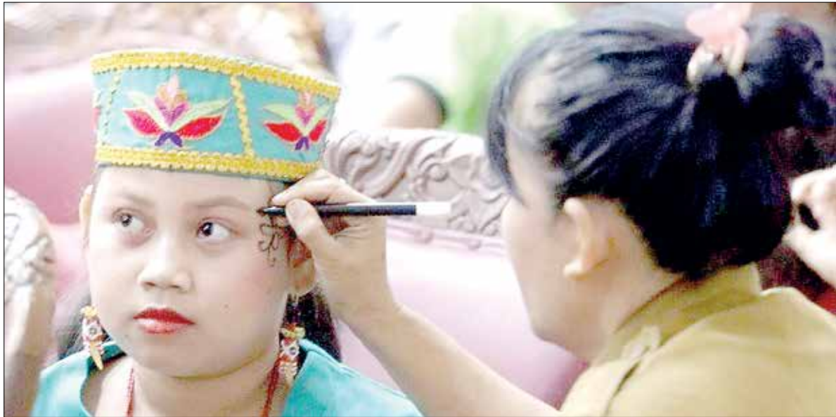
LOMBA: Ratusan siswa se-Kutai Barat mengikuti FLS3N di Aula AJT.

“Kalau sarana fisik sudah clear, maka kita bisa fokus pada pengembangan kualitas pendidikan dan kesejahteraan guru,” pungkasnya. (moe/qi/kri)