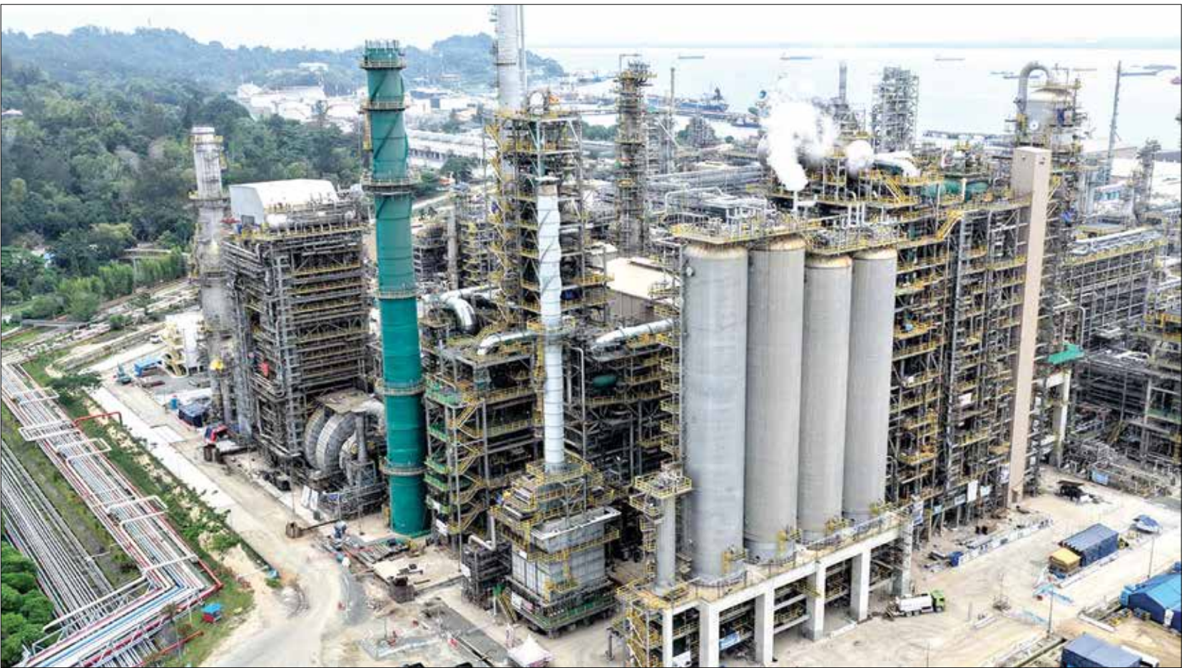
LAMPAUI TARGET: Investor dalam negeri menjadi penyumbang terbesar realisasi investasi di Balikpapan pada 2025 dengan total Rp 23,77 triliun dari 11.753 proyek. Sedangkan investor asing hanya Rp 3,47 triliun dari 1.578 proyek.

Pembiayaan Tembus Rp3,27 Miliar, Ribuan Warga Ikut Wakaf Produktif