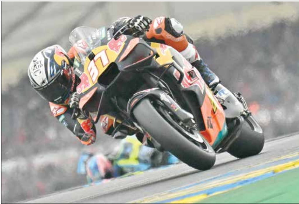
MERASA DIEJEK: Pedro Acosta melewati tikungan di Sirkuit LeMans pada GP Prancis, Minggu (10/5).