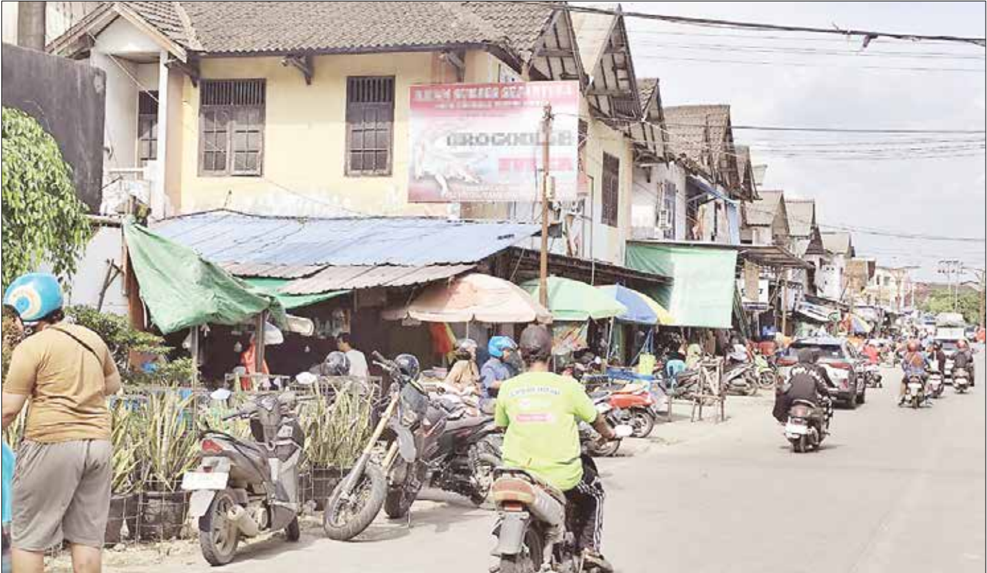
TUNGGU KEPASTIAN: Beberapa warga terlihat beraktivitas di sekitar Pasar Segiri, Kecamatan Samarinda Ulu, beberapa waktu lalu.