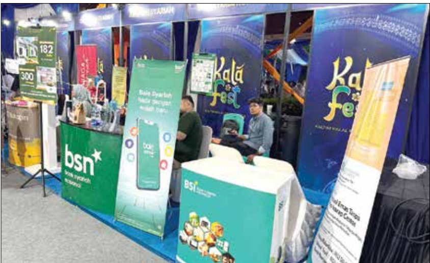
PEMBIAYAAN: Selama tiga hari pelaksanaan, KalaFest 2026 berhasil memfasilitasi 20 pelaku usaha dengan total pembiayaan Rp3,27 miliar.