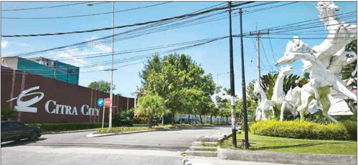
MENATA KENDARAAN: Kawasan Citra City disiapkan Dishub Balikpapan menjadi salah satu kantong parkir di kawasan tertib lalu lintas MT Haryono.