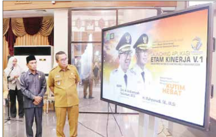
APLIKASI: Wakil Bupati Kutim Mahyunadi (kanan) meluncurkan aplikasi ETAM Kinerja Pembangunan Daerah di Kantor Bupati Kutim, Selasa (12/5).

SANGATTA - Pemkab Kutai Timur (Kutim) mulai menerapkan sistem pengawasan pembangunan berbasis digital melalui aplikasi Evaluasi Terpadu Akuntabilitas dan Monitoring (ETAM) Kinerja Pembangunan Daerah. Aplikasi tersebut diluncurkan Wakil Bupati Kutim Mahyunadi di Ruang Meranti, Kantor Bupati Kutim, Selasa (12/5). ETAM Kinerja disiapkan sebagai instrumen monitoring, evaluasi, dan pelaporan kinerja perangkat daerah yang terintegrasi. Sistem ini juga dilengkapi dashboard pimpinan yang memungkinkan kepala daerah memantau progres kegiatan, realisasi anggaran, hingga kendala di lapangan secara langsung. Dalam sambutan Bupati Kutim yang dibacakannya, Mahyunadi menyebut aplikasi tersebut menjadi bagian dari upaya memperkuat pengendalian pembangunan daerah secara real-time . “Aplikasi ini tentunya menjadi instrumen penting dalam meningkatkan kualitas pengendalian, monitoring, evaluasi, serta akuntabilitas kinerja perangkat daerah secara terpadu dan real-time ,” ujar Mahyunadi.