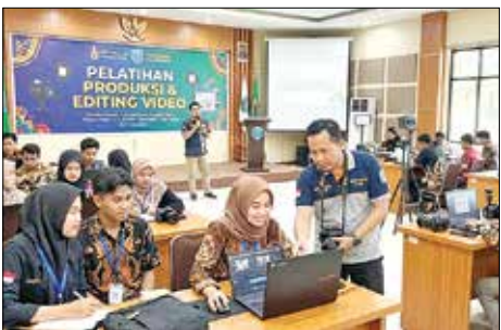
TINGKATAN KUALITAS: Pelatihan videografi berstandar nasional akan digelar Disporapar Paser.