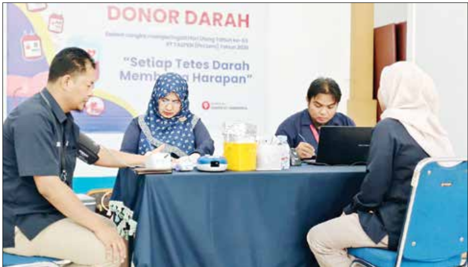
BERBAGI BERSAMA : Menandai perjalanan pengabdiannya yang ke-63 tahun, PT TASPEN (Persero) Kantor Cabang Samarinda tidak sekadar merayakan hari jadi dengan seremoni internal. Mengusung semangat kepedulian terhadap sesama, badan usaha milik negara yang berfokus pada jaminan sosial ASN masa depan.

"Dengan diterimanya bantuan CSR, diharapkan sekolah MI dan MTS dapat semakin berkembang dalam memberikan pelayanan pendidikan yang bermutu serta menjalin sinergi positif antara pihak sekolah, masyarakat, dan dunia usaha," pungkasnya. (pms/as/dra)