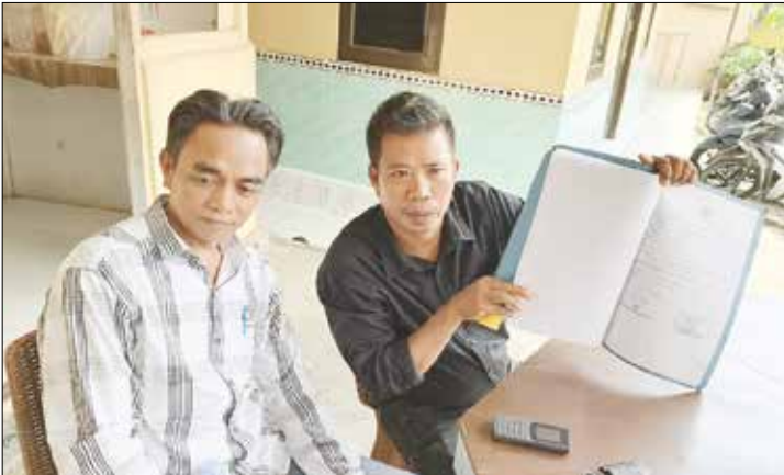
MANDEK: Kuasa hukum korban menunjukkan surat tanda terima laporan pengaduan terkait kasus kehilangan sepeda motor yang viral di media sosial.

Karena merasa laporan berjalan lambat, keluarga korban akhirnya membuat surat terbuka dan video yang kemudian viral di media sosial. Aras menyebut, setelah viral barulah