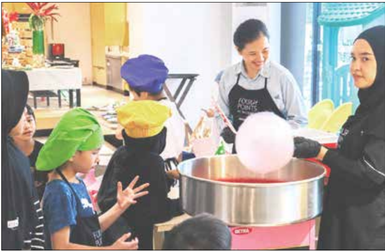
LEBIH KREATIF: Program unggulan di Four Points by Sheraton Balikpapan; Kids Playland. Menghadirkan beragam aktivitas anak seperti Painting, Sensory Play, Cooking Class, hingga Barista Class.

Andhyasoka menambahkan, program ini merupakan bagian dari komitmen hotel untuk menghadirkan layanan yang lebih relevan dengan gaya hidup masyarakat masa kini. “Kami ingin menghadirkan pengalaman menginap yang lebih berkesan melalui berbagai aktivitas yang dapat dinikmati bersama keluarga maupun teman. Program ini tidak hanya ditujukan bagi tamu hotel, tetapi juga terbuka untuk masyarakat umum yang ingin menikmati suasana dan pengalaman di Four Points by Sheraton Balikpapan,” katanya. Menariknya, seluruh rangkaian kegiatan akhir pekan tersebut juga dapat diikuti masyarakat umum tanpa harus menginap di hotel. Penjualan cukup membayar biaya tambahan mulai Rp50 ribu per aktivitas. Melalui program “Weekend Activities”, Four Points by Sheraton Balikpapan berharap dapat menjadi salah satu destinasi pilihan masyarakat untuk menikmati akhir pekan yang lebih produktif, kreatif, sekaligus menyenangkan di Kota Balikpapan. (aji/ms)