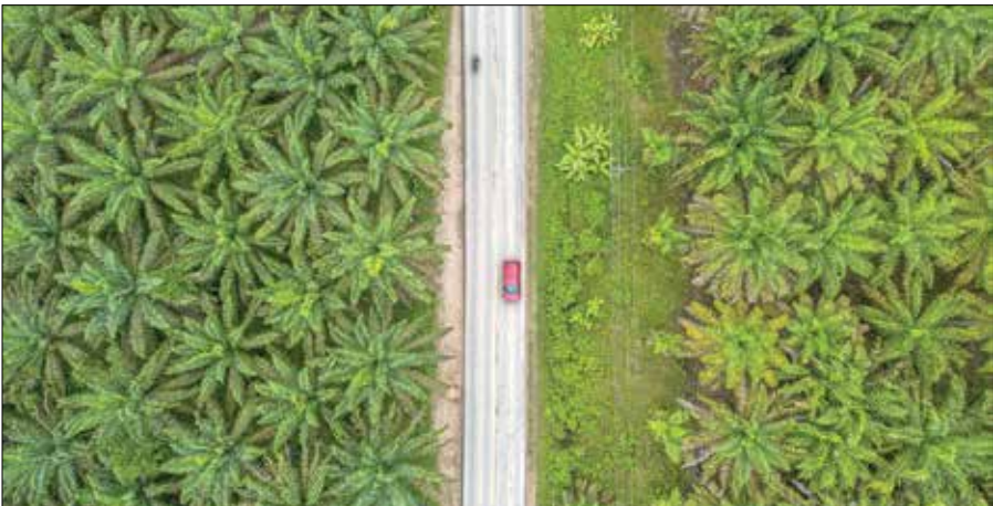
TERBESAR: Indonesia memiliki lahan sawit yang sangat luas. Berdasarkan data Kementerian Pertanian, luasnya mencapai 16,83 juta hektare.