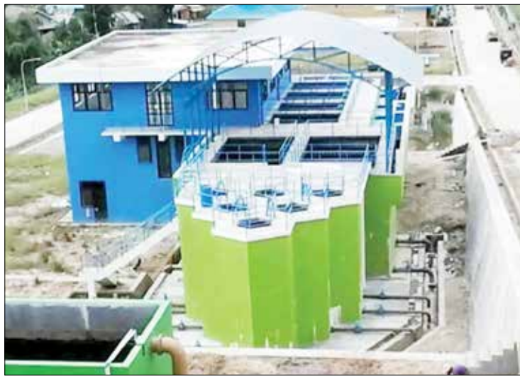
TERGANGGU: Perumd Tirta Kencana Kota Samarinda akan melakukan perbaikan Gutter Sedimen IPA Gunung Lingai pada Rabu (13/5) hari ini.

Lebih lanjut, ia mengatakan kepada masyarakat yang ingin mendapatkan informasi, atau pengaduan dapat menghubungi PDAM Tirta Kencana melalui