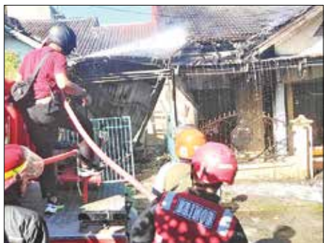
MUSIBAH: Satu rumah ludes terbakar saat jago merah ngamuk di kawasan Perumahan BDS II