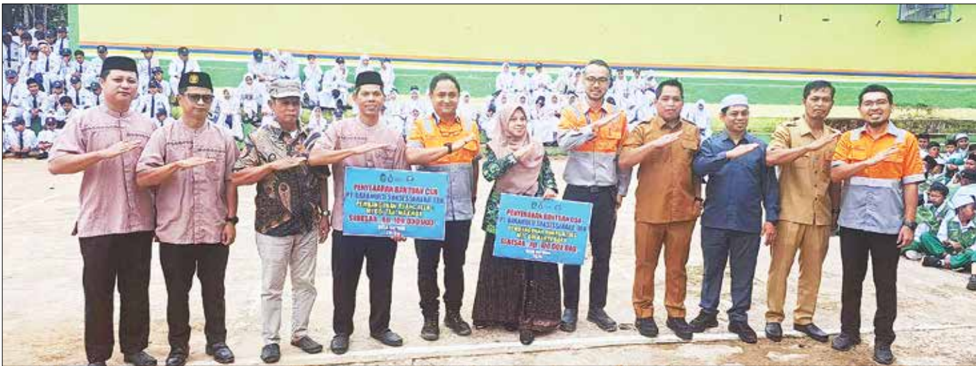
MOMEN: Manajemen PT BSSR abadikan momen bersama pemdes Batuah serta kepala MI dan MTS DDI usai melaksanakan penyerahan hasil kerja pembangunan ruang kelas.