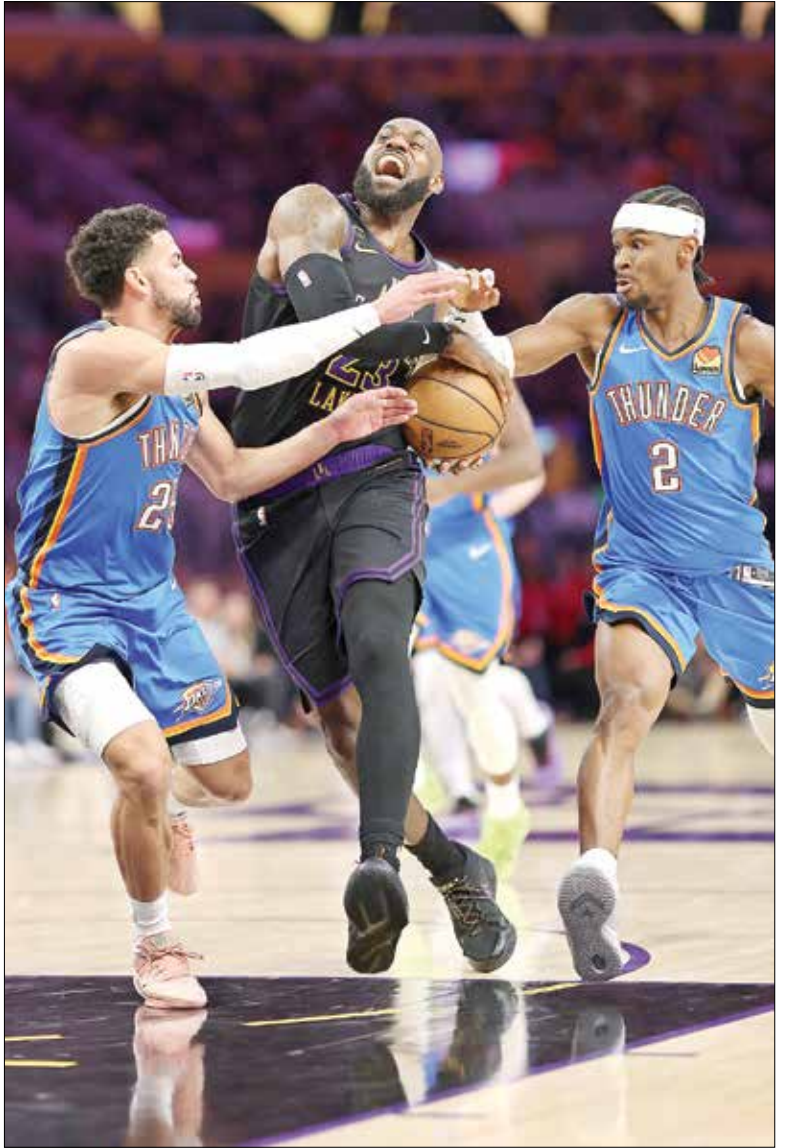
KANDAS: LeBron James (dua dari kiri) dihadang Shai Gilgeous-Alexander (kanan) dan Ajay Mitchell saat hendak memasukkan bola.

Selain itu, Chet Holmgren mencetak 16 poin dengan separuhnya tercipta di kuartel keempat. "Kami bermain dengan baik, mengeksekusi permainan dengan baik, bermain di level tinggi, dan mampu memenangkan delapan pertandingan penting melawan lawan