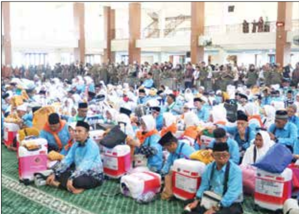
TAMU ALLAH: Suasana khidmat pelepasan rombongan jamaah haji Kota Balikpapan Tahun 1447 H / 2026 M di Masjid Madinatul Iman Balikpapan Islamic Center.