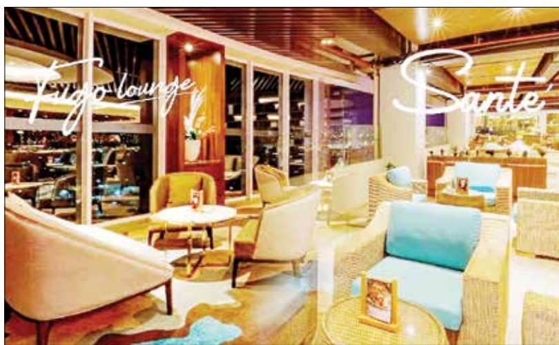
MENJANJIKAN: Dengan suasana yang nyaman, pemandangan yang menarik, serta beragam promo menarik, Sante' Kaffe dan FUGO Lounge siap menjadi pilihan terbaik untuk menikmati waktu santai di tengah Samarinda.

Meski memiliki konsep yang berbeda, keduanya sama-sama menyuguhkan pemandangan indah Samarinda, dengan pemandangan Jembatan Mahakam yang mempercantik suasana, terutama saat sore menjelang malam. Pengunjung juga dapat menikmati beragam pilihan makanan dan minuman yang siap mememani momen berkumpul bersama teman, pasangan, maupun keluarga.