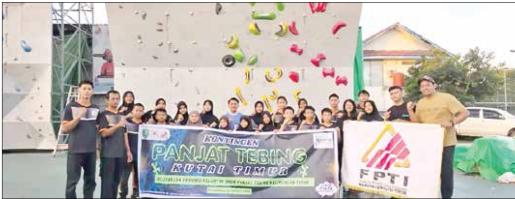
BAWA MISI: Atlet dan ofisial panjat tebing Kutai Timur menjalani persiapan sebelum bertanding pada Kejurprov KU Kaltim 2026 di Samarinda.

Pelatih Lakers, JJ Redick, juga enggan berspekulasi lebih jauh. "Saya bahkan belum memikirkannya. Kita akan membahas offseason saat waktunya tiba, yaitu dalam dua bulan ke depan," ujar Redick. (ka/bas/jpg/er)