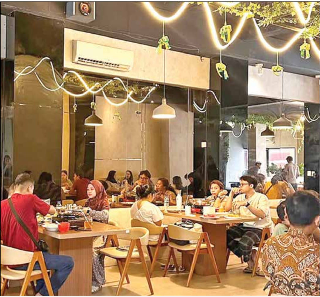
POTENSI PAD: Ilustrasi salah satu restoran di Kota Minyak. Potensi pendapatan daerah dari pajak rumah makan, hotel, hiburan, parkir, dan sebagainya harus digenjut agar target PAD Rp18 triliun bisa terealisasi.