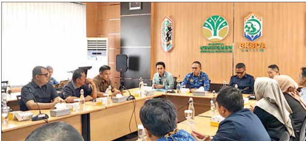
CARI SOLUSI: Isu cagar alam masih jadi permasalahan pembangunan yang banyak ditemukan di beberapa desa di Kabupaten Paser.