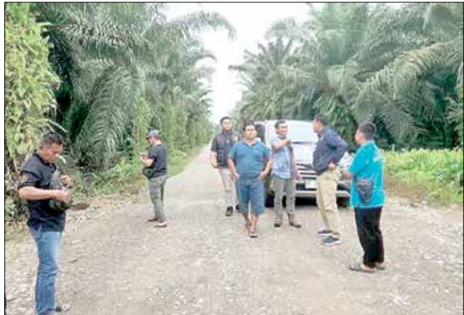
PROSES HUKUM: Penyidik dan pelapor saat melakukan pengecekan lapangan dugaan penggelapan lahan plasma di Kampung Muara Siram, Bongon.

“Ini sejarah. Jarang kita dengar laporan masyarakat kecil melawan raksasa (korporasi) bisa naik ke tahap penyidikan hingga penahanan. Kami sangat mengapresiasi profesionalisme Unit Pidum Polres Kubar,” ujar Tonang, Selasa (12/5/2026). Namun, bagi Tonang, pena-