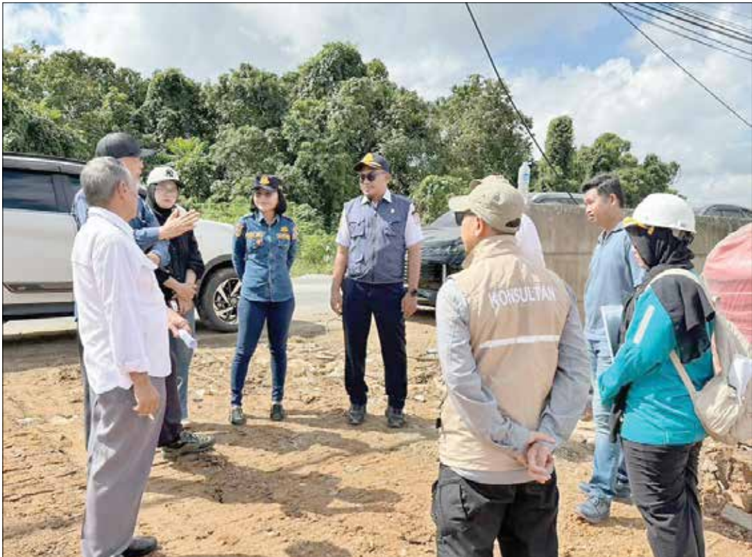
SOLUSI KEMACETAN: Pelaksanaan tahap awal pekerjaan MC0 land clearing yang dilakukan Dishub Balikpapan bersama instansi terkait untuk memulai pembangunan depo kontainer di Kilometer 13.