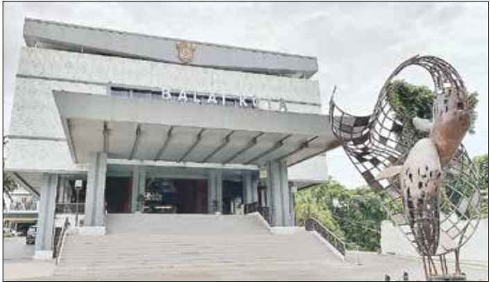
PELUNASAN BERTAHAP: Utang pemkot tahun 2025 mencapai sekitar Rp 400 miliar dan akan dibayarkan secara bertahap sepanjang 2026.

Proses pembayaran dilakukan melalui tahapan administrasi yang diawali review Inspektorat, sebelum dimasukkan ke APBD dan dibuatkan Dokumen Pelaksanaan Anggaran (DPA) khusus pembayaran utang. Namun, pembayaran tidak dapat