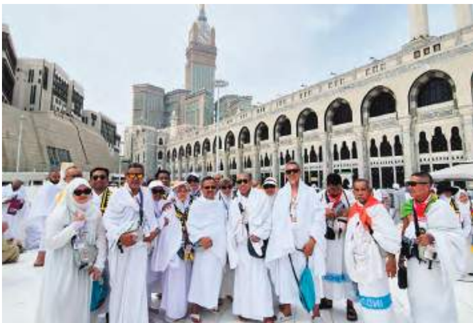
JEMAAH haji asal Sulteng kloter BPN-9 berfoto bersama di sekitar Masjidil Haram, Makkah, Minggu (10/5/2026).