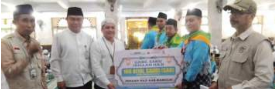
PENYERAHAN secara simbolis uang saku kepada salah seorang jemaah haji asal Banggai, di agenda pelepasan, di Masjid Agung Annur Luwuk, Minggu (10/5/2026).

BANGGAI, MERCUSUAR – Bank Perkreditan Rakyat Syariah (BPRS) Khairan Inti Amanah memberikan bantuan sebesar 100 Riyal Arab Saudi (SAR) kepada setiap jemaah haji asal Kabupaten Banggai.