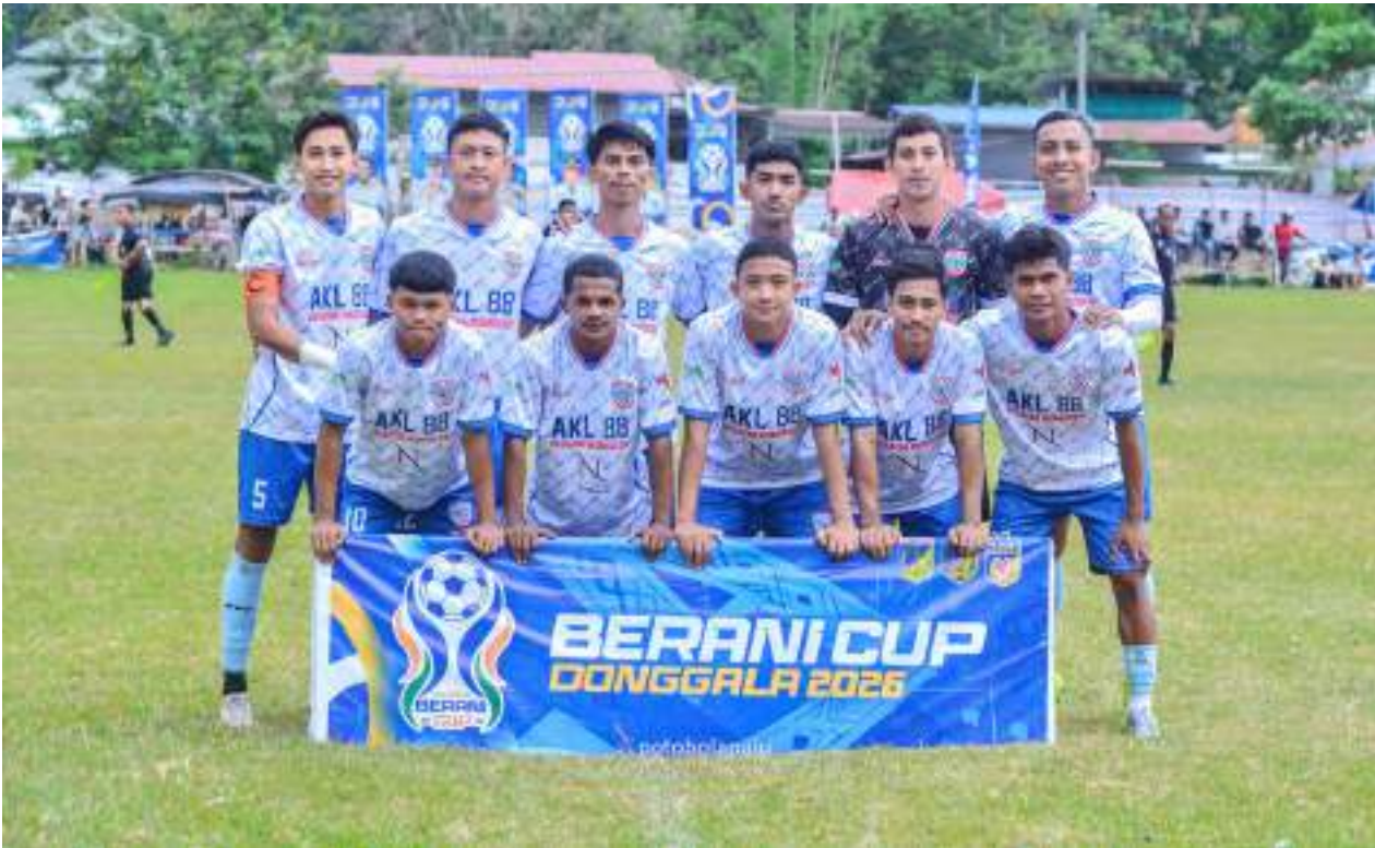
SKUAD AKL88 FC.

DONGGALA, MERCUSUAR - Akl88 FC menutup babak penyisihan grup Berani Cup Donggala 2026 dengan kemenangan meyakinkan usai menundukkan Dondo United dengan skor 3-0 pada laga terakhir fase grup H, Sabtu (9/5/2026).