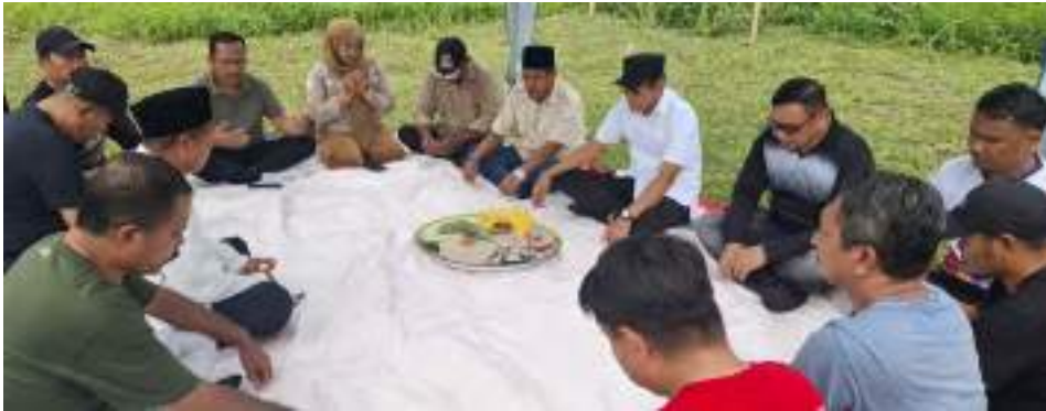
SYUKURAN pembukaan lahan yang akan dibangun SR, di Desa Jono Kalora Kecamatan Parigi Barat, Jumat (8/5/2026).

PARIGI MOUTONG, MERCUSUAR – Pemerintah Kabupaten Parigi Moutong (Pemkab Parmout) menyiapkan lahan seluas 9,240 hektare, untuk pembangunan Sekolah Rakyat (SR) di Desa Jono Kalora Kecamatan Parigi Barat.