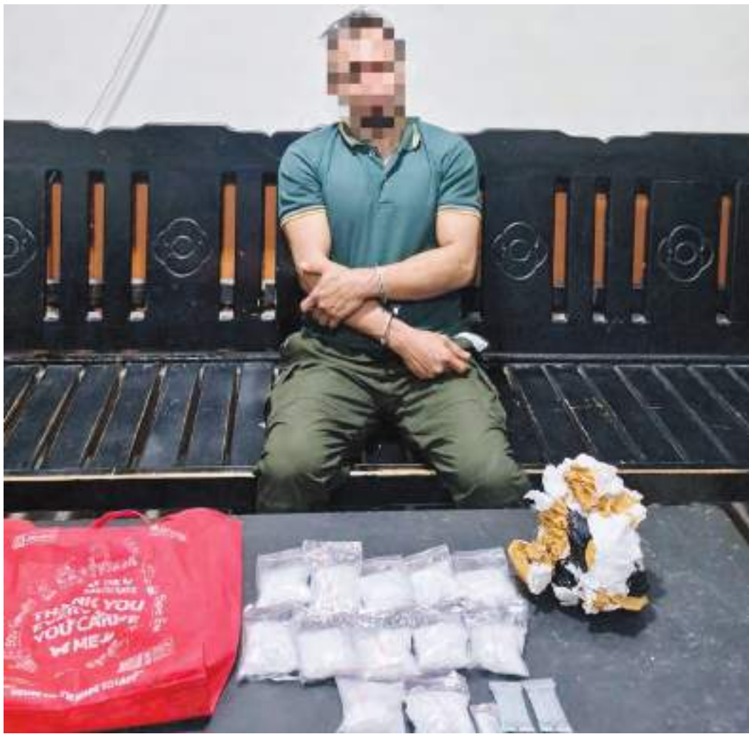
TERDUGA pelaku berinisial AL saat diamankan beserta barang bukti sabu-sabu seberat sekira 626 gram.

menemukan satu sachet plastik cetik bening ukuran kecil diduga berisi sabu-sabu di saku celana MS. “Total 13 paket, 12 paket sedang, satu paket kecil dengan berat timbangan bruto 626,08 gram,” kata Direktur Reserse Narkoba Polda Sulteng, Kombes Polisi Pribadi Sembiring, Minggu (10/5/2026). Selain mengamankan sabu-sabu, petugas juga menyita barang bukti lain berupa kantong belanja warna merah dan kantong plastik hitam. Berdasarkan hasil pemeriksaan awal, MS mengakui barang haram tersebut merupakan miliknya. “Sabu-sabu itu diduga dibawa atau didapatkan dari Kota Palu untuk diedarkan kembali di wilayah Kabupaten Morowali,” ungkap Sembiring. IKI