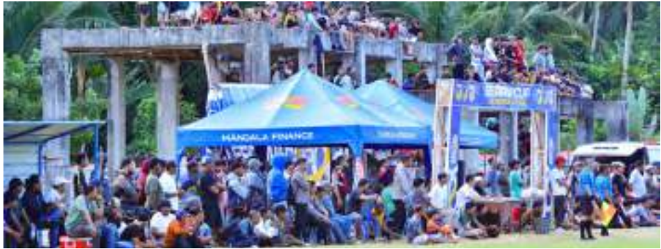
SALAH satu sudut iven Berani Cup Donggala 2026.

DONGGALA, MERCUSUAR – Setelah istirahat selama dua hari, panitia Turnamen Berani Cup Donggala 2026 resmi merilis jadwal pertandingan babak 16 besar yang akan mulai bergulir pada Selasa, 12 Mei 2026.