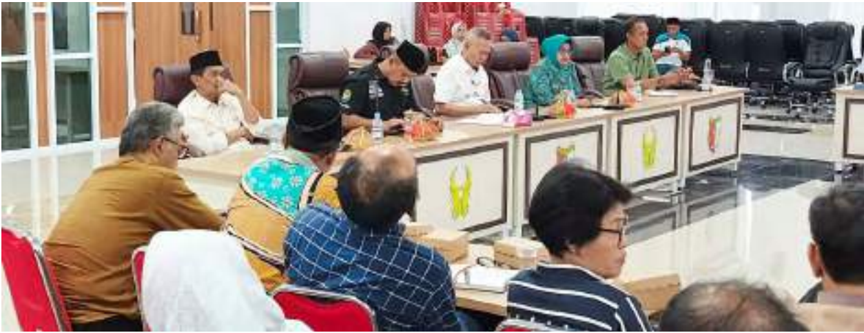
RAKOR pelaksanaan MTQ XXXI tingkat provinsi Sulteng, di Aula Kantor Bupati Sigi, Jumat (8/5/2026).

Ia juga menaruh harap, jemaah turut mendoakan kesejahteraan masyarakat Kabupaten Banggai saat berada di Arafah, salah satu tempat mustajab untuk berdoa dalam rangkaian ibadah haji. Selain itu, Rusli mendoakan agar seluruh jemaah haji diberikan kelancaran selama menjalankan ibadah di Tanah Suci hingga kembali ke daerah dengan predikat haji mabrur. TOP