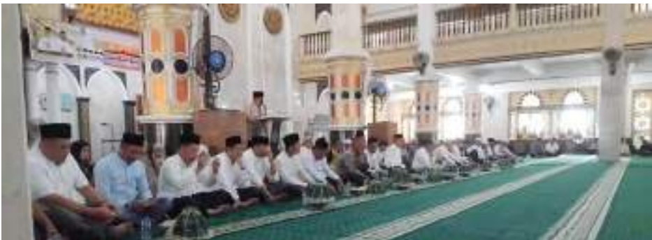
PELEPASAN jemaah haji asal Kabupaten Banggai, di Masjid Agung Annur Luwuk, Minggu (10/5/2026).

“Doakan masyarakat, pemerintah daerah dan Kabupaten Banggai agar selalu maju dan sejahtera,” pintanya.