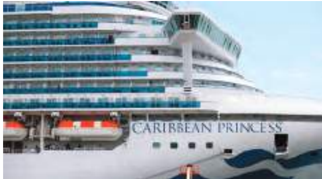
SEBANYAK 115 penumpang dan kru kapal pesiar Caribbean Princess dilaporkan jatuh sakit setelah terinfeksi norovirus. FOTO: GETTY IMAGES VIA AFP/JOE RAEDLE

MERCUSUAR-Sebanyak 115 penumpang dan kru kapal pesiar Caribbean Princess dilaporkan jatuh sakit setelah terinfeksi norovirus penyebab muntah dan diare (muntaber). Penyakit akibat virus ini sangat umum terjadi dan sangat menular.