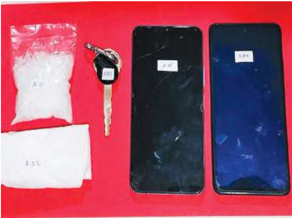
BARANG bukti sabu-sabu disita petugas dari tangan terduga pengedar narkoba.

BESUSU BARAT, MERCUSUAR - Satuan Reserse Narkoba Polresta Palu kembali mengungkap dua kasus dugaan tindak pidana narkoba jenis sabu-sabu di wilayah Palu dalam waktu berdekatan. Tiga terduga pelaku masing-masing berinisial M.R. (24), N.S. (31), dan S.I.L. berhasil ditangkap a Jumat (8/5/2026) hingga Minggu (10/5/2026) di lokasi berbeda. Penangkapan pertama dilakukan terhadap SL pada Jumat malam sekira pukul 23.30 Wita di Jalan Mepati, Kelurahan Tanamodindi, Kecamatan Mantikulore. Dari tangan pelaku, polisi menyita dua paket