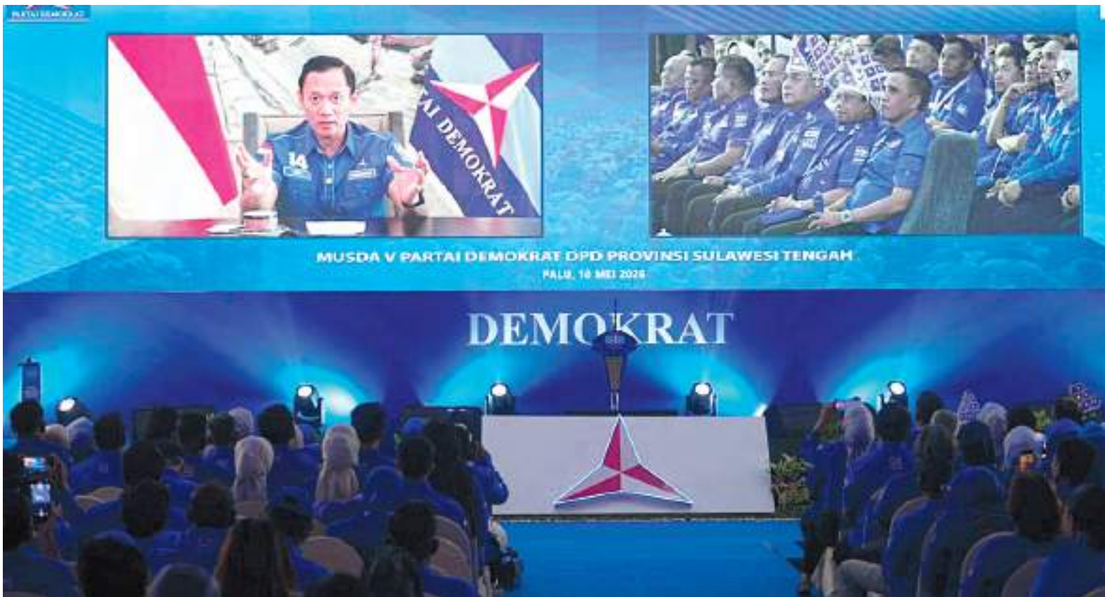
PESERTA Musda V Demokrat Sulteng mendengarkan arahan Ketum Partai Demokrat, Agus Harimurti Yudhoyono secara virtual di Grand The Sya Hotel, Minggu (10/5/2026).